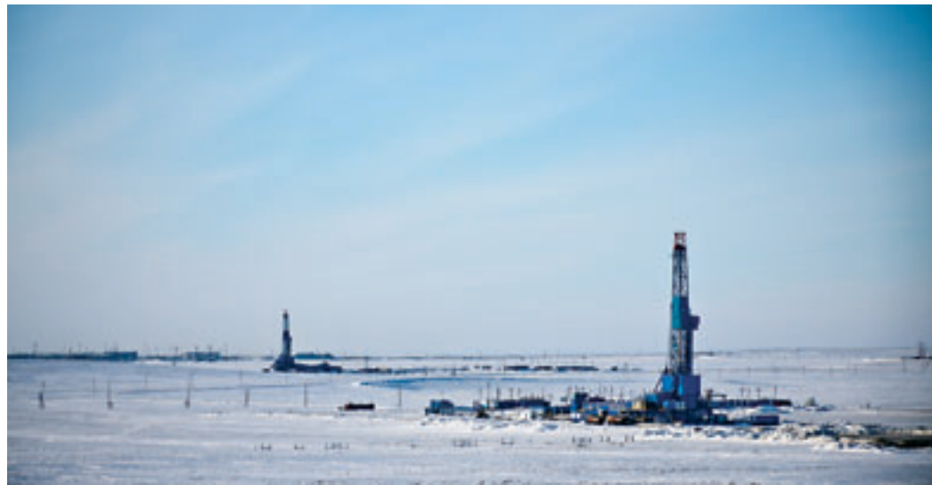
На стратегических просторах Ямала.